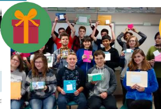
お土産エクステンジ