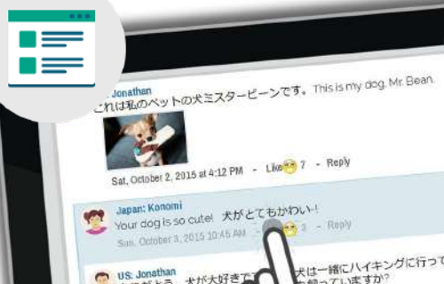
教育用交流ウェブサイト上でのやりとり