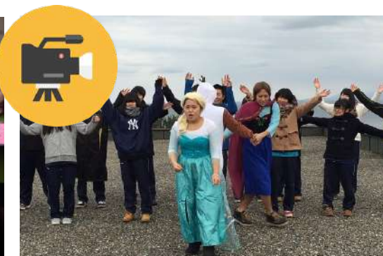
ビデオ制作コンテスト